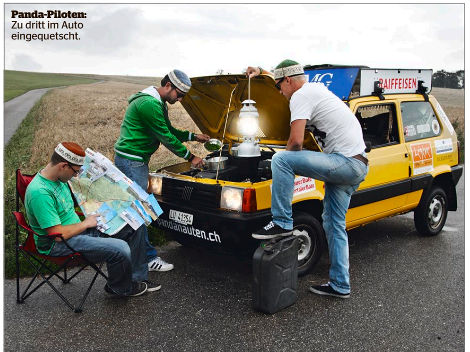
Panda-Piloten: Zu dritt im Auto eingequetscht.

und ihr Kleinwagen sicher in Ulaanbaatar ankommen. Damit es auch ganz sicher zu keinen Platten und Pannen kommt, gibt es morgen eine offizielle Fahrzeugtaufe und eine Abschlussparty im Restaurant Woods in Schötz. Dann heisst es Abschied nehmen vom Dorf und in die weite Welt hinaus rollen. Am 14. Juli fällt im südenglischen Goodwood der offizielle Startschuss zur Mongol Rally. web