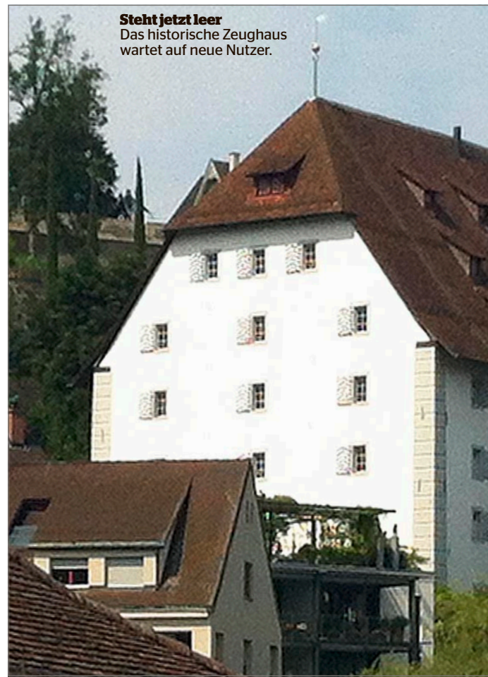
Steht jetzt leer Das historische Zeughaus wartet auf neue Nutzer.

Ist es sogar denkbar, dass der Kanton das Zeughaus verkauft? «Gemäss der Immobilienstrategie ist der Kanton offen für Vermietungen an Dritte oder die Abgabe des ganzen Gebäudes im Baurecht.» ●